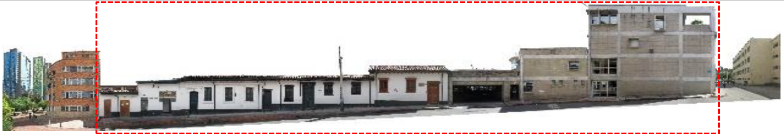
CALLE 19 BIS