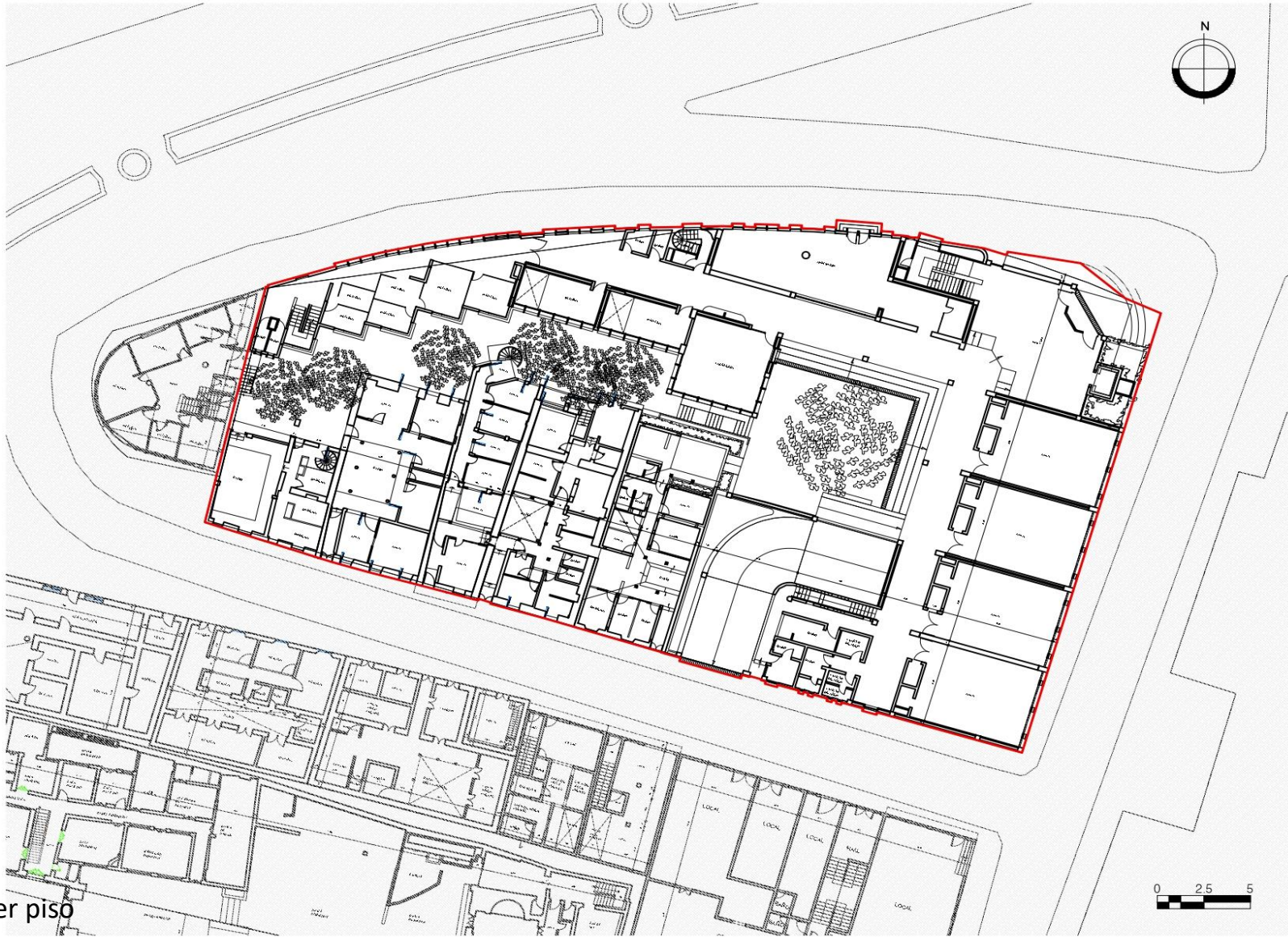
Planta primer piso